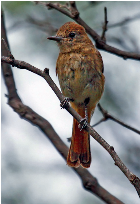
Foto 4. Juvenil de Knipolegus hudsoni en Retamito, Sarmiento, San Juan, fotografiado el 5 de febrero de 2011.