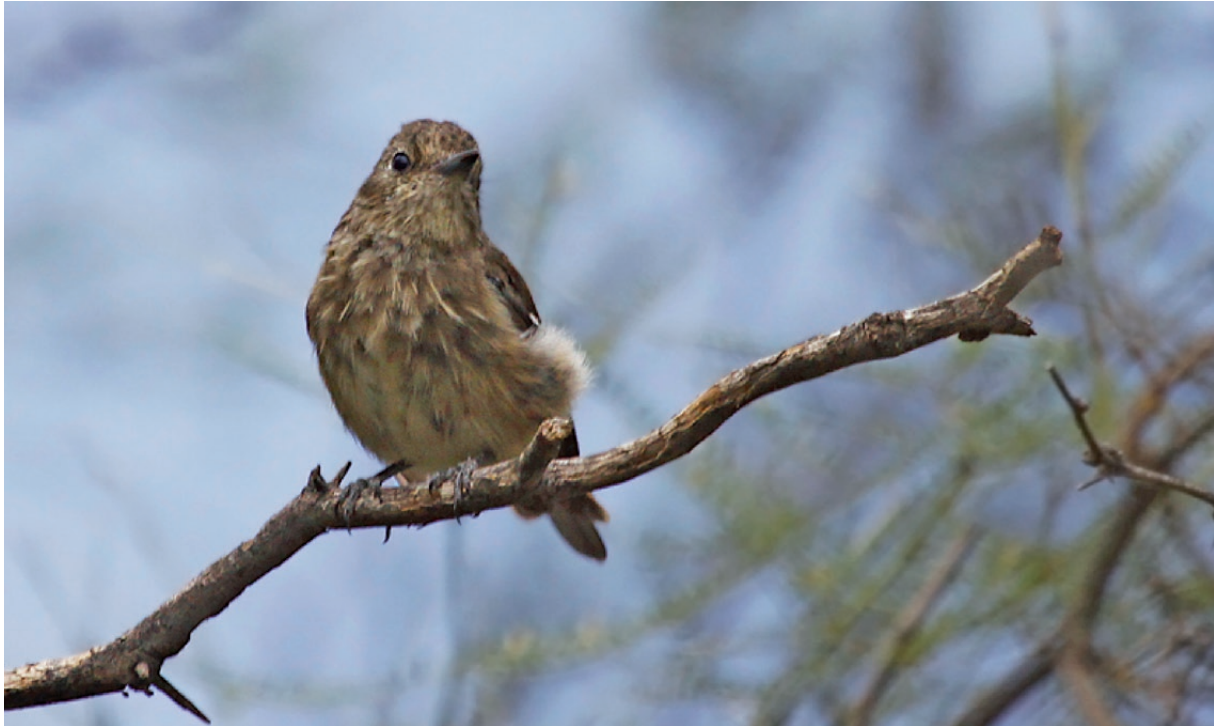
Foto 3. Hembra adulta en Retamito, Sarmiento, San Juan observada el 5 de febrero de 2011.