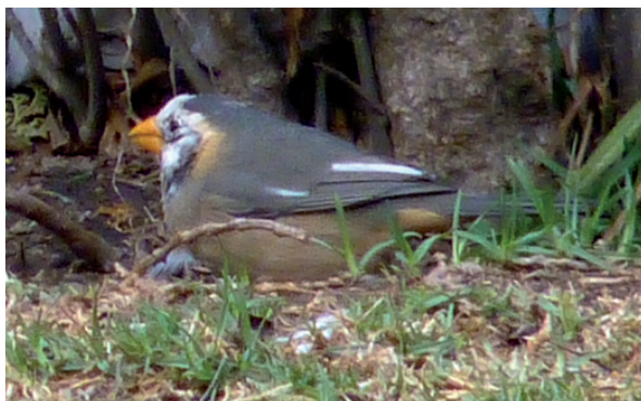
Fotos 1 y 2. Leucismo en un ejemplar de Siete Cuchillos ( Saltator aurantirostris ).