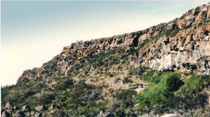
Foto 3. Paredón de nidificación de las parejas de Falco sparverius y Geranoaetus melanoleucus en Estancia "El Cuadro"