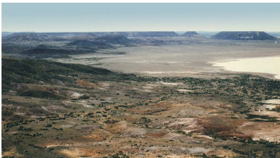
Foto 1. Características topográficas del área de estudio. Distrito Patagónico Central en Santa Cruz.

En este estudio la hembra cumplió un rol protagónico en la defensa del territorio de nidificación. No obstante, no debe soslayarse la importante contribución del macho en esta tarea durante el período de crianza (al menos 13 ataques registrados por parte de este ejemplar durante el período mencionado). Este fenómeno quizás pueda encontrar una explicación en la equiparación temprana de roles que se da en esta especie (a diferencia de la mayoría de las aves de presa) cuando, a partir de los 10 días de vida de los pichones, la hembra comienza a dejar el nido para colaborar con el macho en la captura de presas (Balgooyen, 1976) (esto implicaría una menor responsabilidad del macho en la provisión de alimentos y, por lo tanto, la posibilidad de destinar un porcentaje mayor de su tiempo a la custodia del nido). Con respecto a este último ítem, la hembra que nos ocupa fue vista capturando y llevando presas al nido (lagartijas) incluso con anterioridad a los 10 días de vida de los pichones. Observaciones focales de este nido demostraron que la hembra ya realizaba el 20 % de los aportes de alimento al nido en esta primera etapa del período de crianza (De Lucca, 1993).