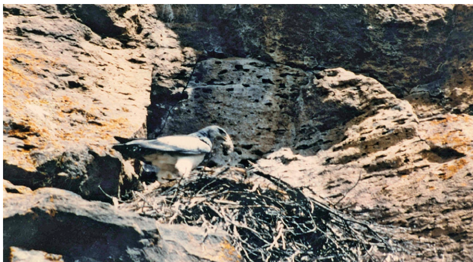
Foto 2. Un integrante de la pareja de Geranoaetus melanoleucus de este estudio aportando una presa al nido.