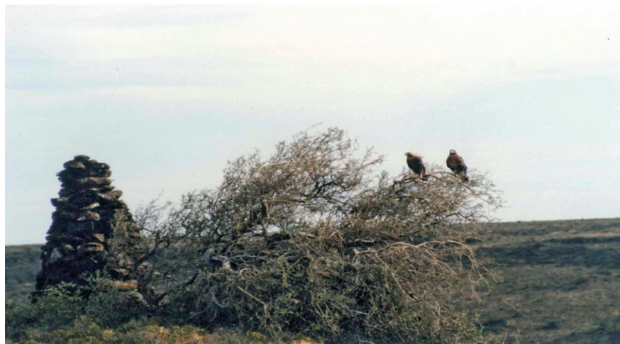
Foto 4. Posaderos comunes de la pareja de Geranoaetus melanoleucus y de Falco sparverius en la parte superior del paredón de nidificación. Juveniles de águilas recién salidos del nido en enero de 1999.

Los datos aquí presentados sobre el rol de los sexos en la defensa territorial se contraponen, en parte, con la información existente sobre esta especie publicada por estudios previos. Tanto en Estados Unidos como en Venezuela, Balgooyen (1976, 1989) observó que los machos y las hembras defendían el nido con igual vigor, destacando que los primeros lo hacían con mayor intensidad previa a la eclosión pero con menor vehemencia que las hembras luego del nacimiento de los pichones. Por su parte, Roest (1957) afirma que, temprano en la temporada, los machos atacan a humanos en cercanías de los nidos con más frecuencia que las hembras y que estas no son particularmente agresivas luego del nacimiento de los pichones. En futuros estudios será conveniente tener presente estos estudios con el objetivo de identificar posibles factores responsables de las diferencias observadas.