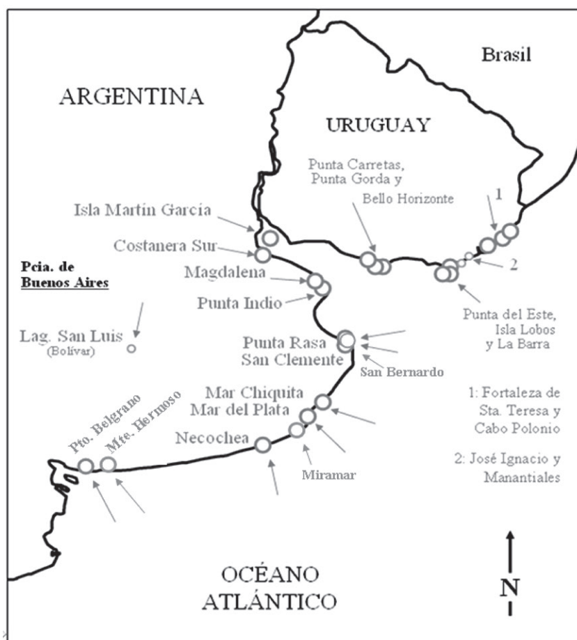
Figura 1. Sitios con registros de Fregata magnificens en Uruguay y la Argentina.

Faz -30 km al Este- (Antas, 1991, Orta, 1992 y Sick, 1993), en las aguas tropicales de la “sección oriental de las islas oceánicas de Brasil” (Antas, 1991). Su área de dispersión es conocida hasta el paralelo 25° S en las costas de Brasil, aproximadamente hasta el estado de Paraná en su desplazamiento más al Sur según se interpreta de Harrison (1987), es decir a unos 1.100 km de las islas donde se reproduce.